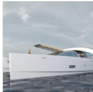
( http://www.0-100.it/wp-content/uploads/2013/07/Anteprima-Salone-di-Cannes-2013_catamaran-AIR-77-by-Oxygene-Yachts_0-100_3.jpg )