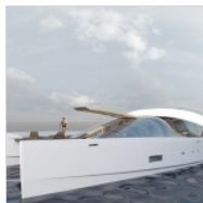
( http://www.0-100.it/wp-content/uploads/2013/07/Anteprima-Salone-di-Cannes-2013_catamaran-AIR-77-by-Oxygene-Yachts_0-100_7.jpg )