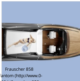
Frauscher 858 Fantom ( http://www.0-100.it/frauscher-858-fantom/ ) ( http://www.0-100.it/frauscher-858-fantom/ )