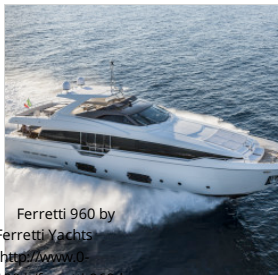
Ferretti 960 by Ferretti Yachts ( http://www.0-100.it/ferretti-960-by-ferretti-yachts/ ) ( http://www.0-100.it/ferretti-960-by-ferretti-yachts/ )