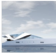
( http://www.0-100.it/wp-content/uploads/2013/07/Anteprima-Salone-di-Cannes-2013_catamaran-AIR-77-by-Oxygene-Yachts_0-100_2.jpg )