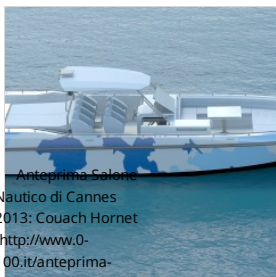
Anteprima Salone Nautico di Cannes 2013: Couach Hornet ( http://www.0-100.it/anteprima-salone-nautico-di-cannes-2013-couach-hornet/ ) ( http://www.0-100.it/anteprima-salone-nautico-di-cannes-2013-couach-hornet/ )